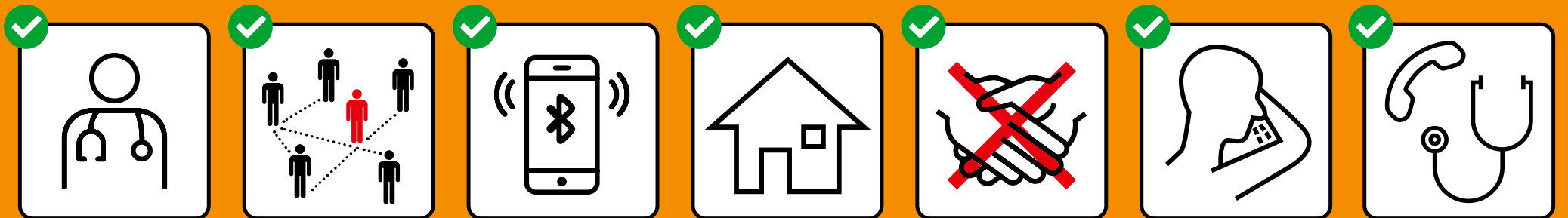
Bei Symptomen sofort testen lassen und zuhause bleiben.